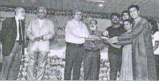
ଅତିଥିମାନେ ବିଦ୍ୟାଥୀଙ୍କୁ ସମର୍ଥନ କରୁଛନ୍ତି।