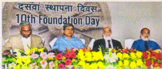
వ్యవస్థాపక దినోత్సవ వేదికపై అధిపతులు